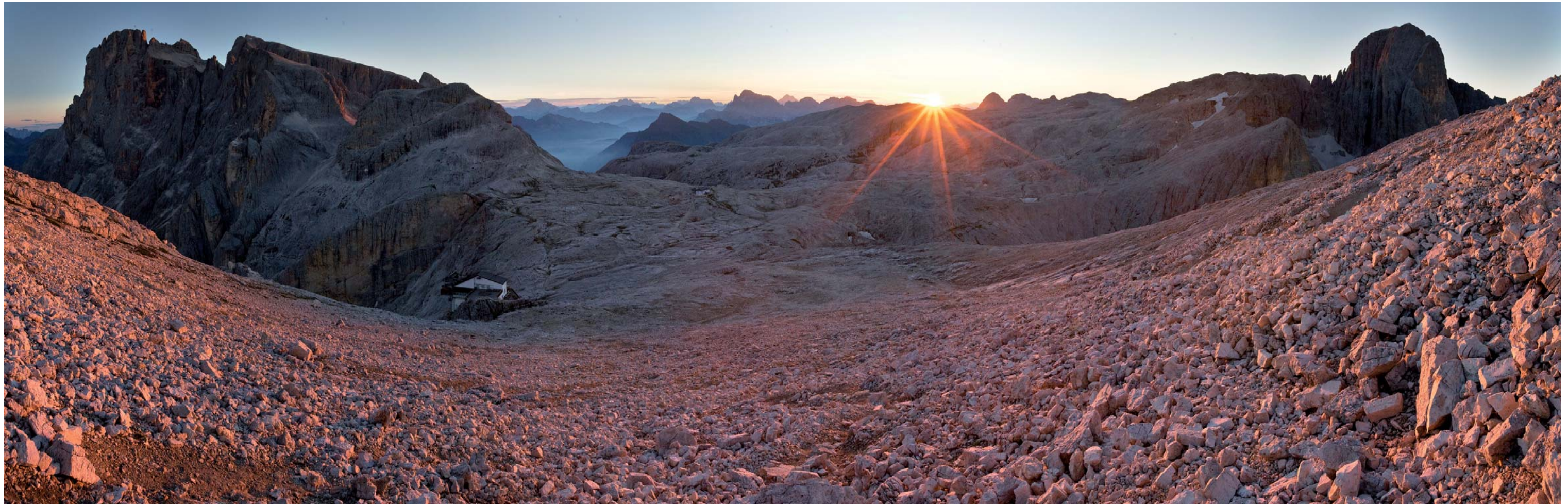
Gesamtansicht, links der Cimon della Pala, rechts die Pala di San Martino / Panoramica, a sinistra il Cimon della Pala, a destra la Pala di San Martino