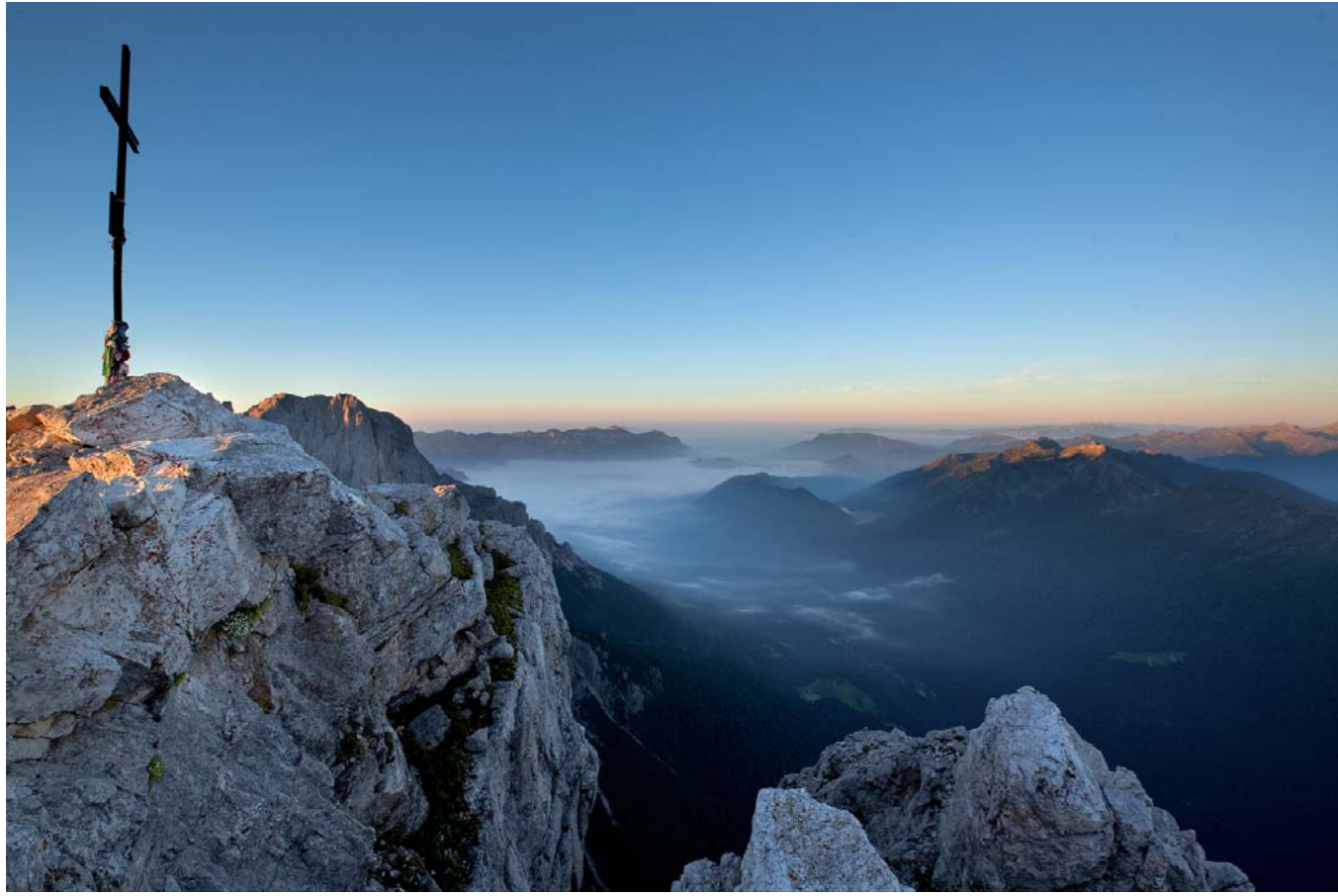
Cima Rosetta e Primiero all'alba / Rosetta Gipfel und Primiero bei Tagesanbruch