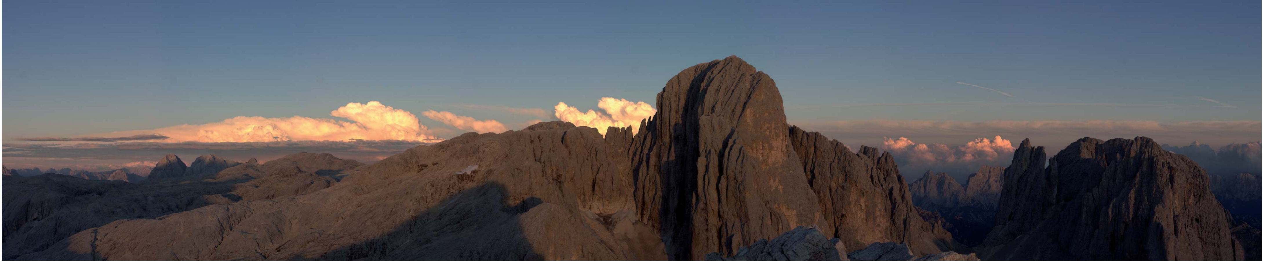
Sonnenuntergang auf der Pala di San Martino / Tramonto sulla Pala di San Martino