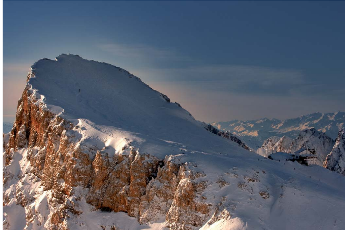
Rosetta Gipfel und die Bergstation der Seilbahn / Cima Rosetta e la stazione superiore dell'omonima funivia